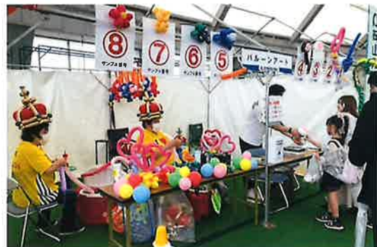
「バルーンアート」出展