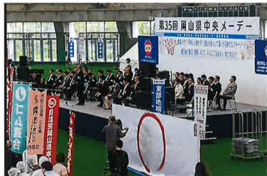
連合岡山 森会長 挨拶