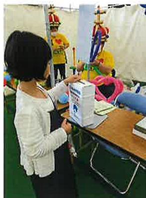
生活応援基金 (カンパ箱)