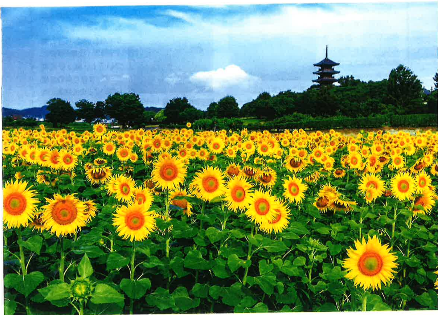
備中国分寺のひまわり