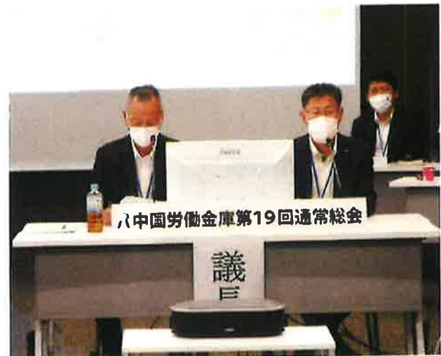
議長：藪本理事・北川鉄工所労働組合（向って左） 本地理事・中国電力労働組合広島統括本部（向って右）