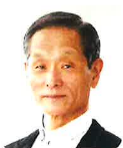
くらしき 田原相談員