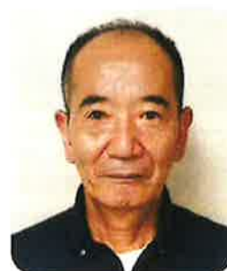
つやま 寒竹相談員