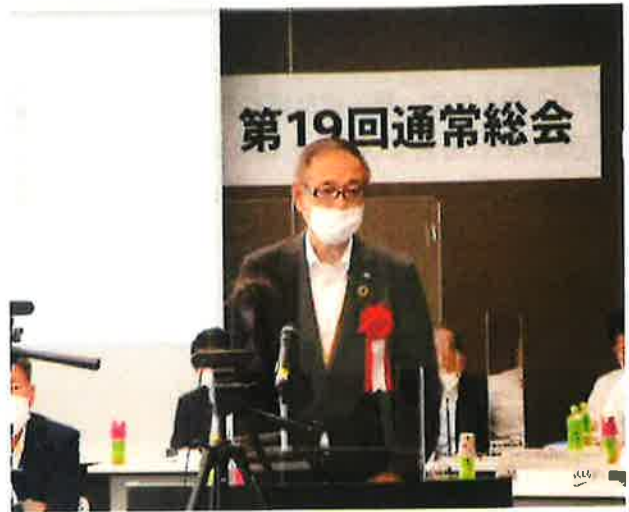
来賓あいさつ 労福協中国ブロック連絡会 久光会長