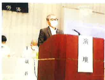
吉葉専務理事 議案提案