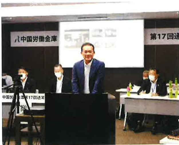
戸守理事長あいさつ