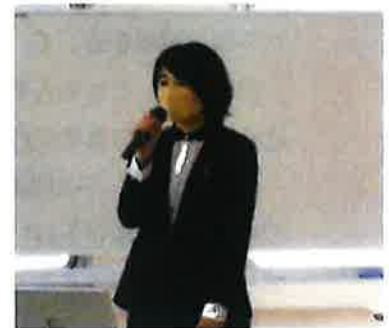
中国労金研修会風景