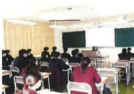
オンラインでの授業風景