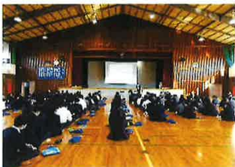
体育館での授業風景

なお、2023年1月には岡山県立津山商業高等学校において「消費者講座」と「ワークルール講座」を行う予定です。