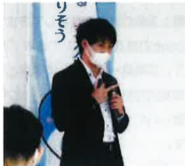
こくみん共済研修会風景